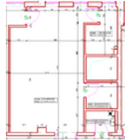
Załącznik nr 3 rzut lokalu 26

Informacja Zamawiającego o zawarciu umowy PDF pdf, 198.22 KB, 13.12.2023